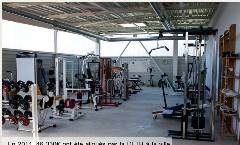
En 2014, 46 330€ ont été alloués par la DETR à la ville d'Etain pour l'extension du local handisport